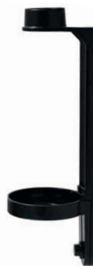
PT50004224 Soporte de pared para botella dosificadora